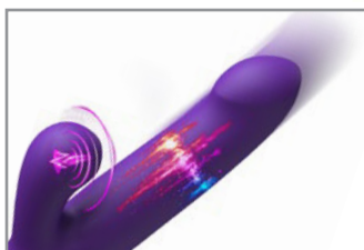
NEW! PERCUSSION THRUSTING, WITH FLICKERING AND VIBRATION!

Includes: (1) Rabbit Thruster & (1) Magnetic Charging Cord